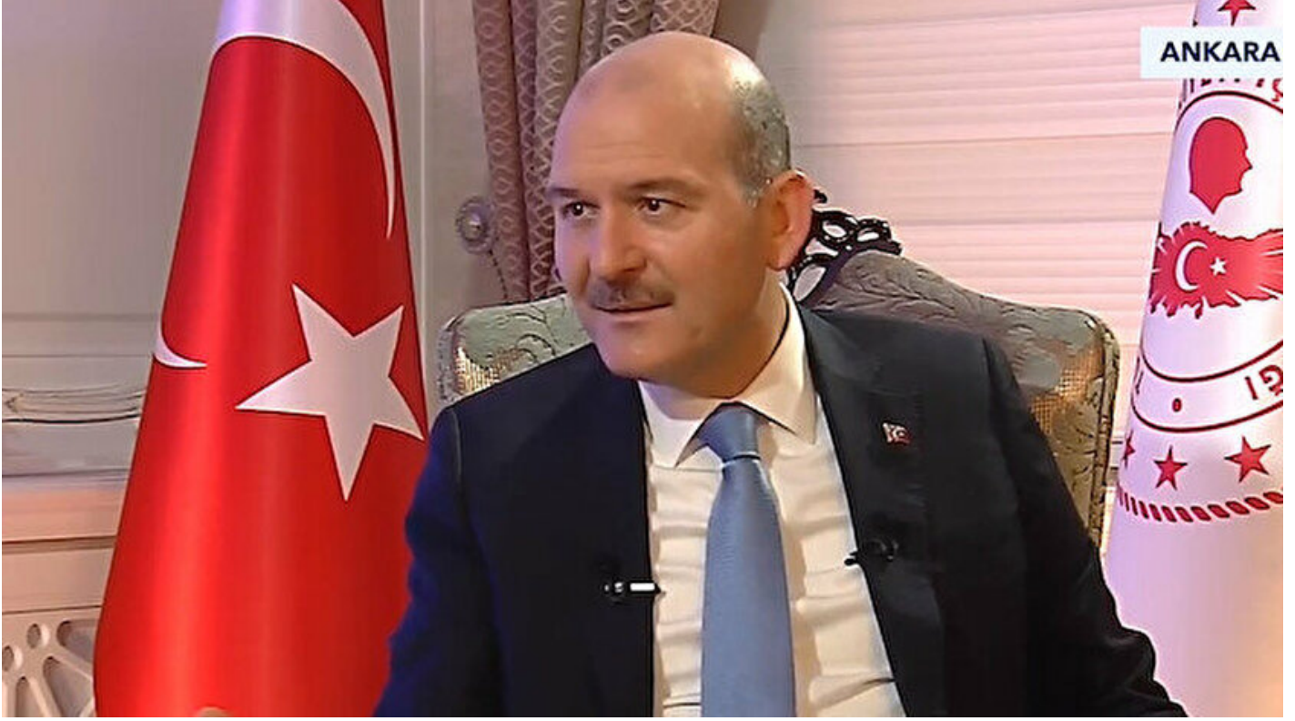
İçişleri Bakanı Süleyman Soylu