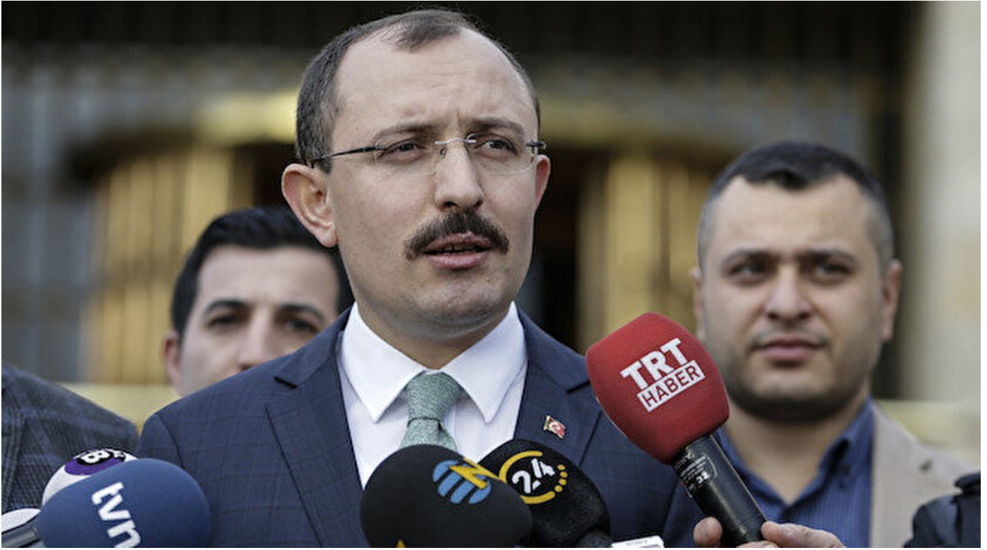
AK Parti Grup Başkanvekili Mehmet Muş.

Haber Merkezi · 23 Eylül 2019, 12:20 · Son Güncelleme: 23 Eylül 2019, 13:25 · IHA