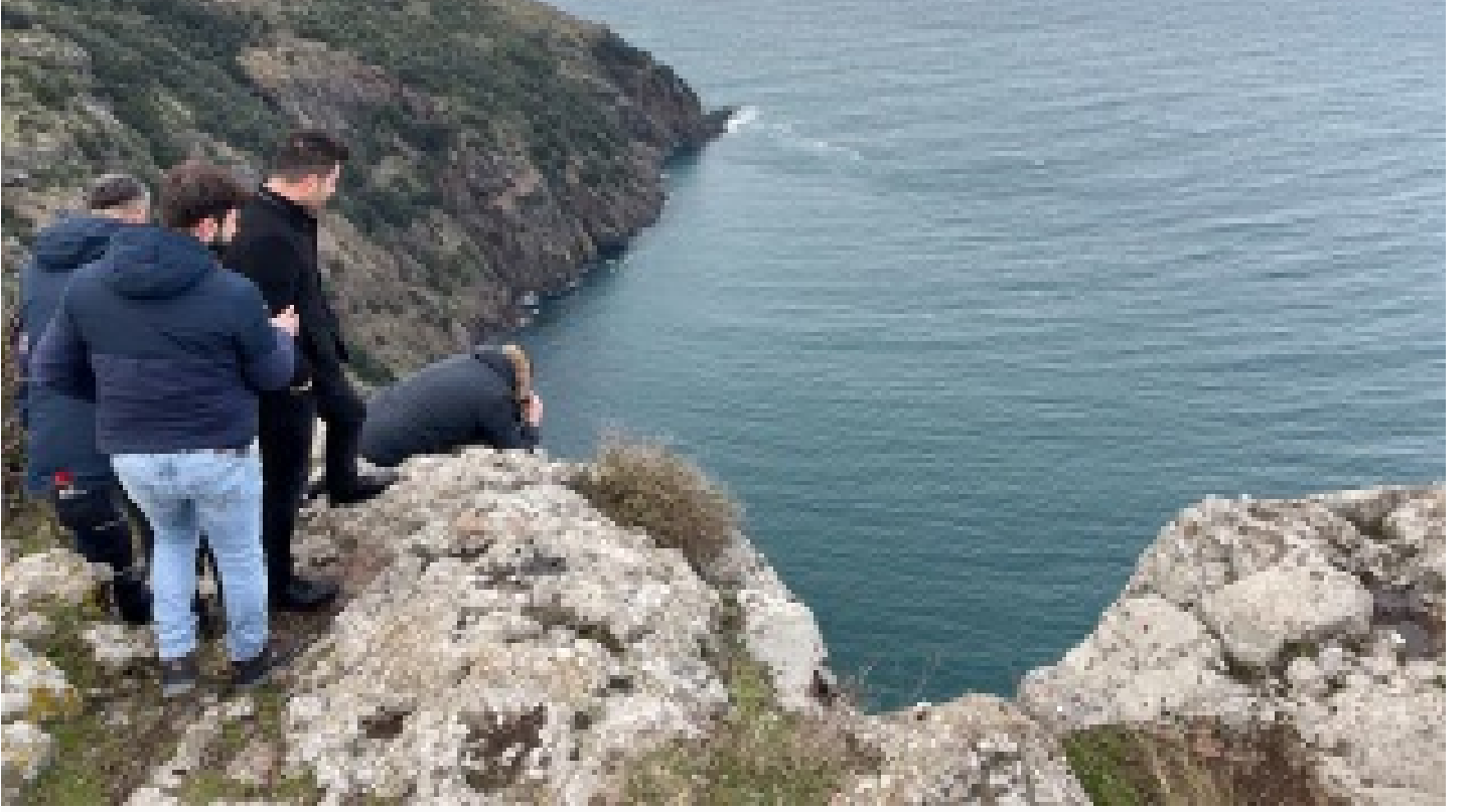
Sinop'ta uçurumda kadın cesedi bulundu