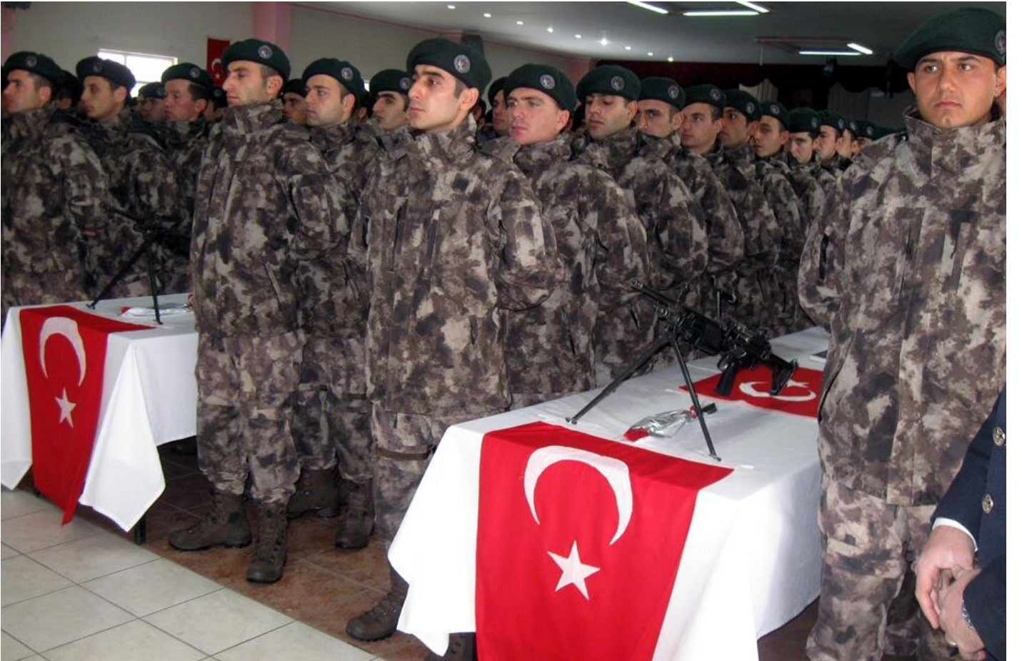
Amasya'nın Merzifon ilçesinde bulunan Merzifon Polis Meslek Eğitim Merkezi'nde eğitim gören ve mezun olan 642 özel