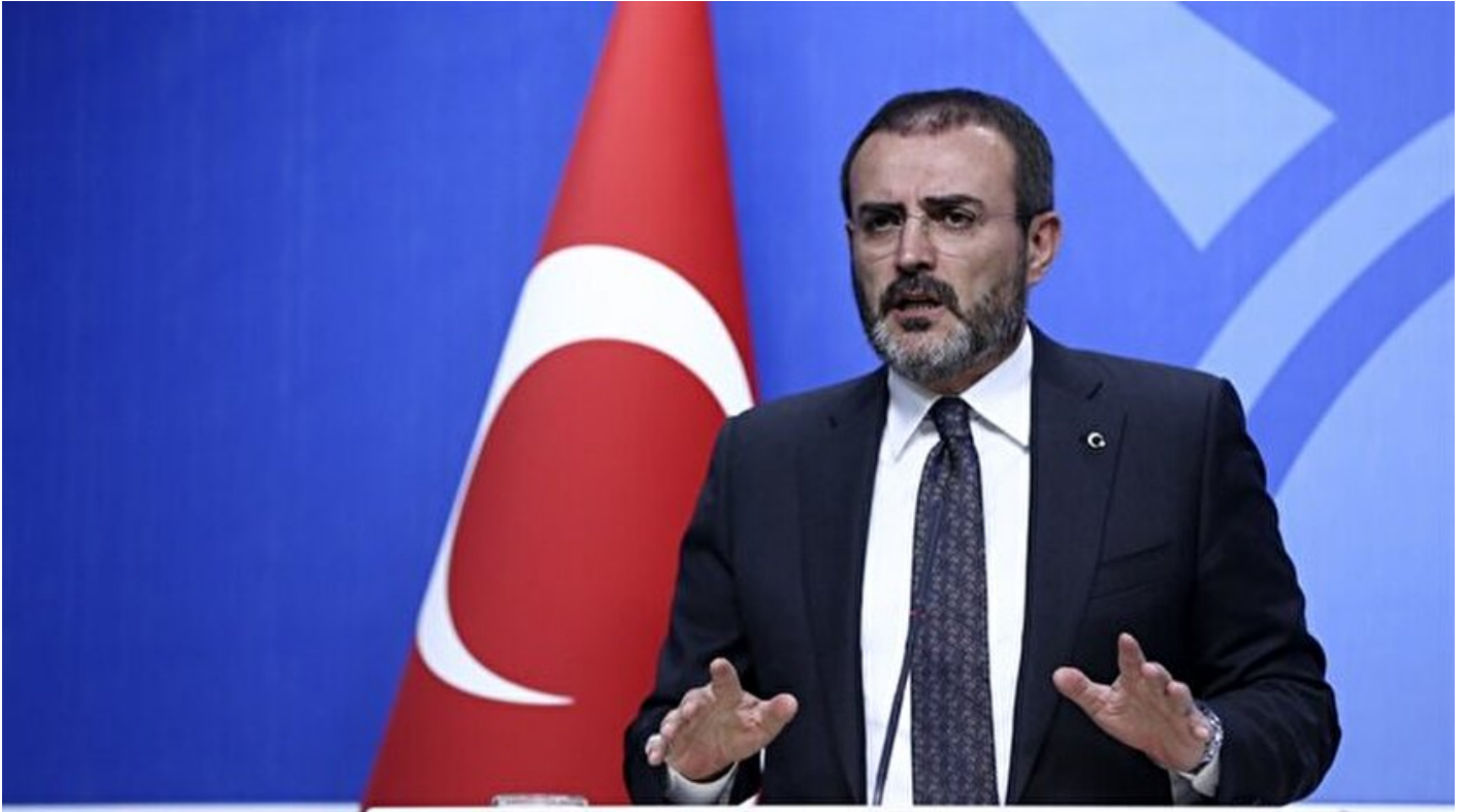
AK Parti Genel Başkan Yardımcısı ve Sözcüsü Mahir Ünal