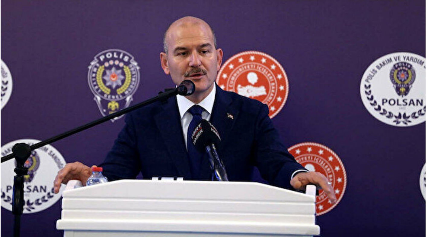
İçişleri Bakanı Süleyman Soylu.

Haber Merkezi · 13 Nisan 2019, 12:09 · Son Güncelleme: 13 Nisan 2019, 12:13 · DHA