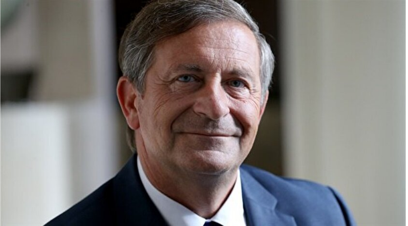
Slovenya Başbakan Yardımcısı ve Dışişleri Bakanı Karl Erjavec

Haber Merkezi · 01 Haziran 2017, 12:08 · Son Güncelleme: 01 Haziran 2017, 12:12 · AA