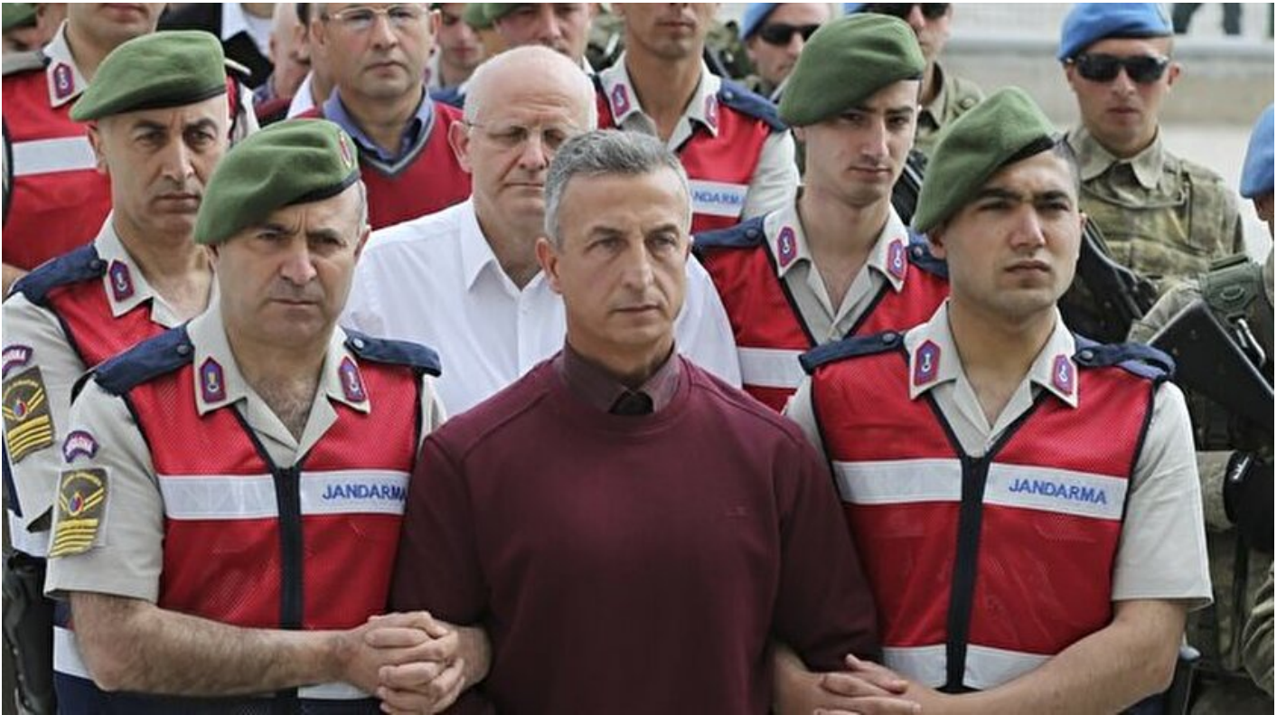
Darbe girişiminde görev alan cuntacı general Erhan Caha

Osman Özgan · 25 Mayıs 2017, 04:00 · Son Güncelleme: 25 Mayıs 2017, 07:14 · Yeni Şafak