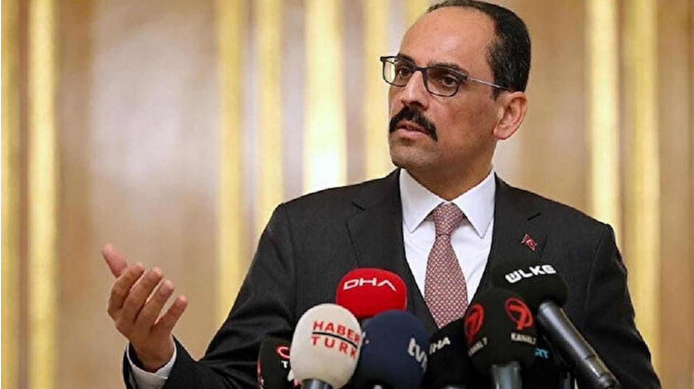
Cumhurbaşkanlığı Sözcüsü İbrahim Kalın