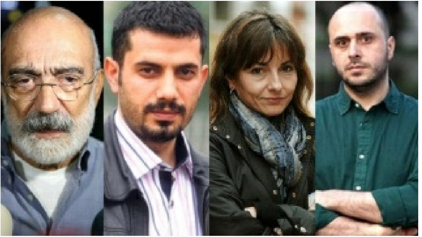
Balyoz kumpas davasında karar