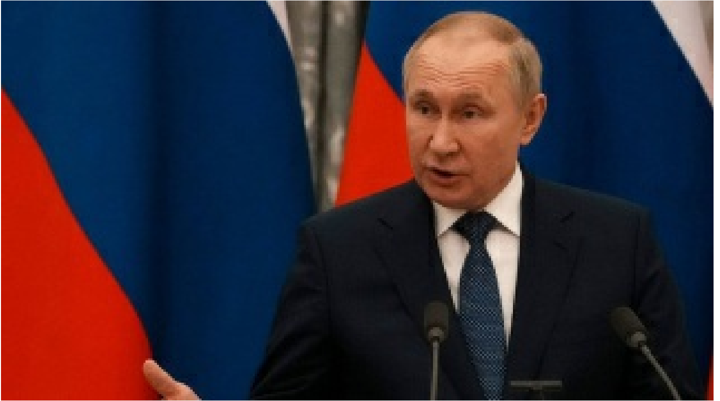
Putin'den ülkelere ilişkileri normalleştirme çağrısı