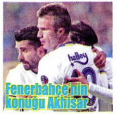
Fenerbahçe'nin konuğu Adnan SÜPER Lig'in 27. haftasında Fenerbahçe evinde Adnan ile karşılaşacak. Ülker Stadı'nda 19.00'da başlayacak maç hakem Halil Uraler yönetecek.

YAKLAŞIK 2 milyon 650 bin devlet memuru oylarını anmsatan Bayrakçı, "Bu yüzde 4'lük kesimin görüşünü hiçbir anket şirketi yakalayamıyor. Onun için birkaç puanla 'evet' önde buluyorlar" açıklamasına yaptı. Bayrakçı "Gölecek için teklifin olan kararlar bir 'hayır' ile kitle varken, 'evet' cephesi kemetlenmiş değil" dedi. TEVFIK KADAN'ın haberi 7'de