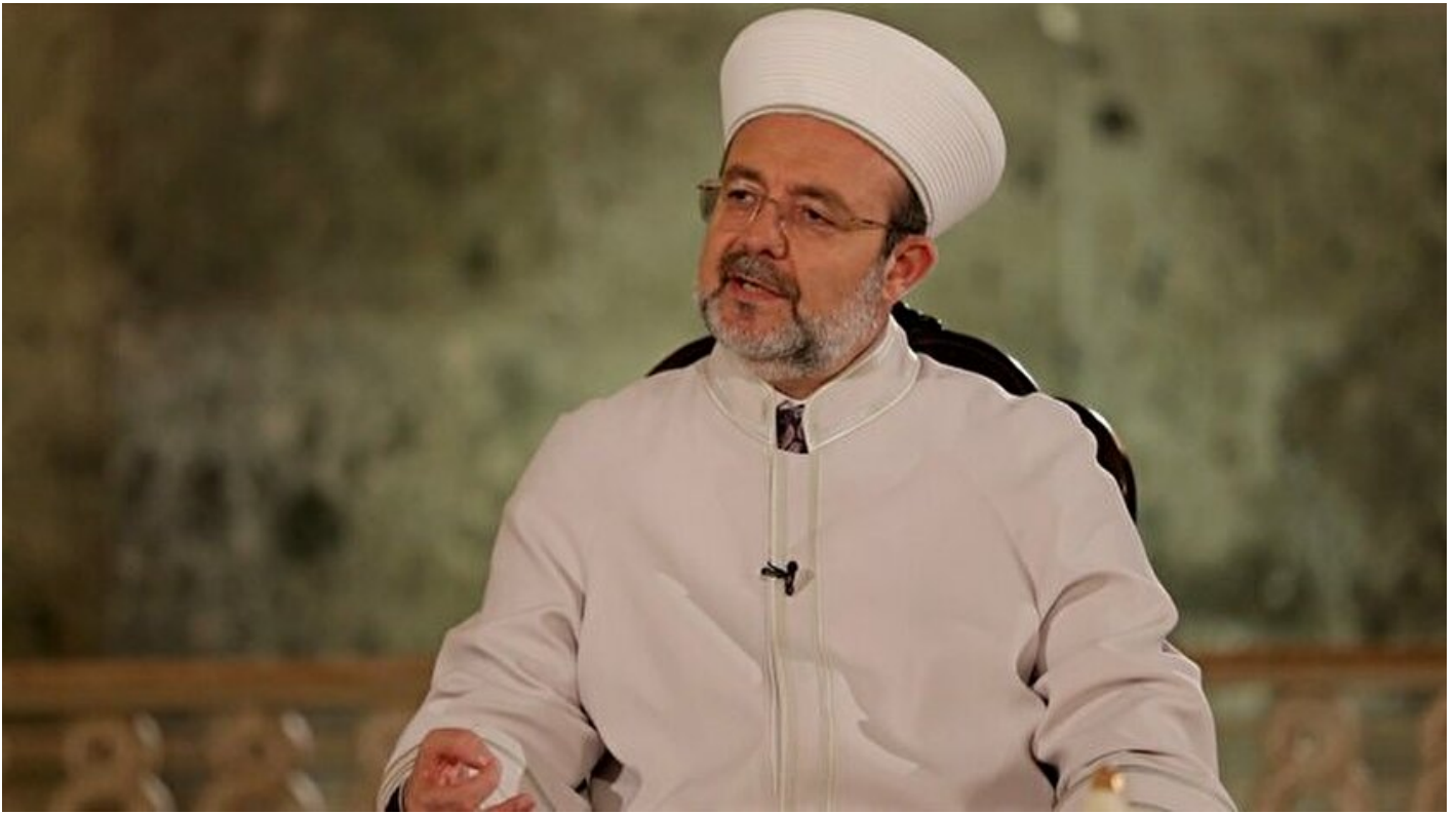
Diyanet İşleri Başkanı Görmez