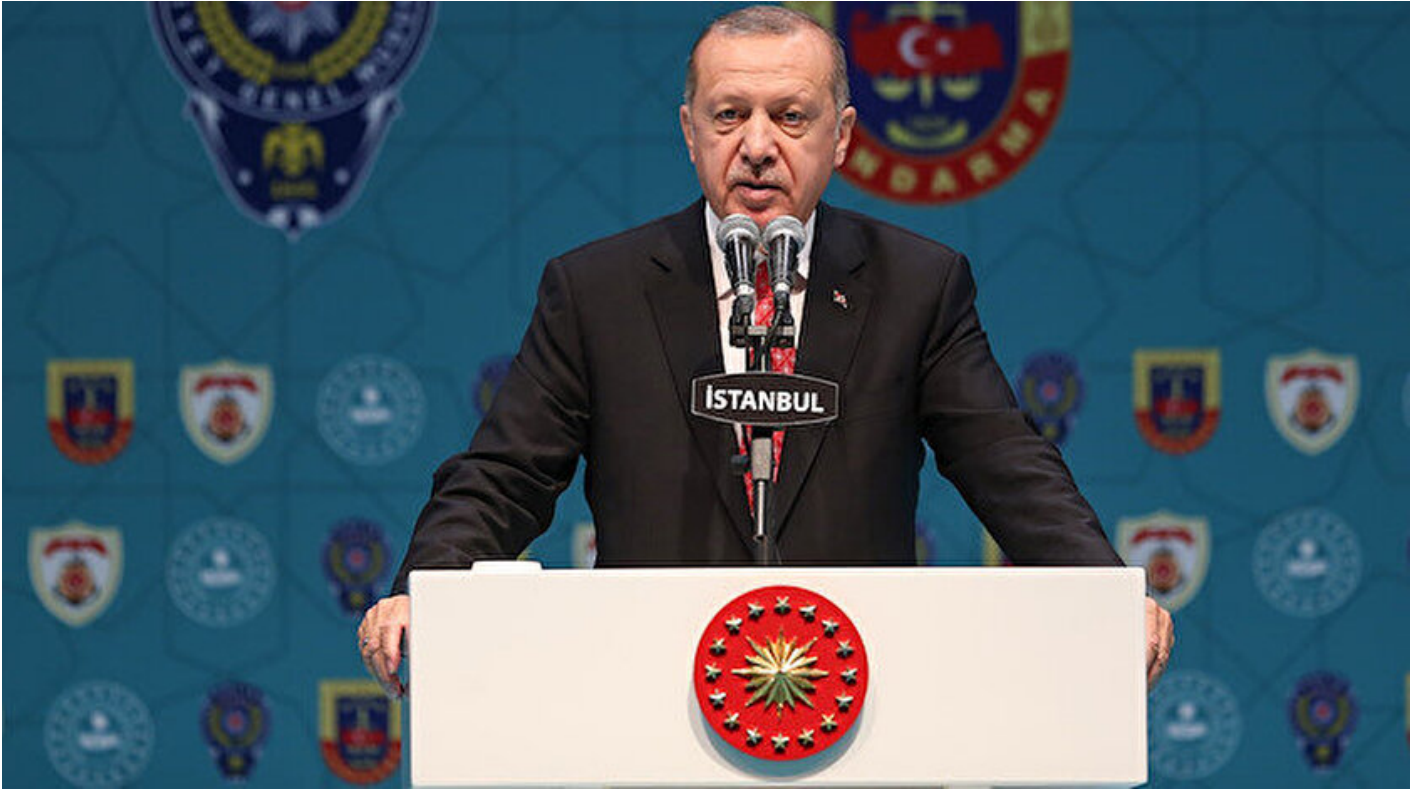
Cumhurbaşkanı Recep Tayyip Erdoğan

Haber Merkezi · 16 Mayıs 2019, 21:28 · Son Güncelleme: 17 Mayıs 2019, 00:17 · Yeni Şafak