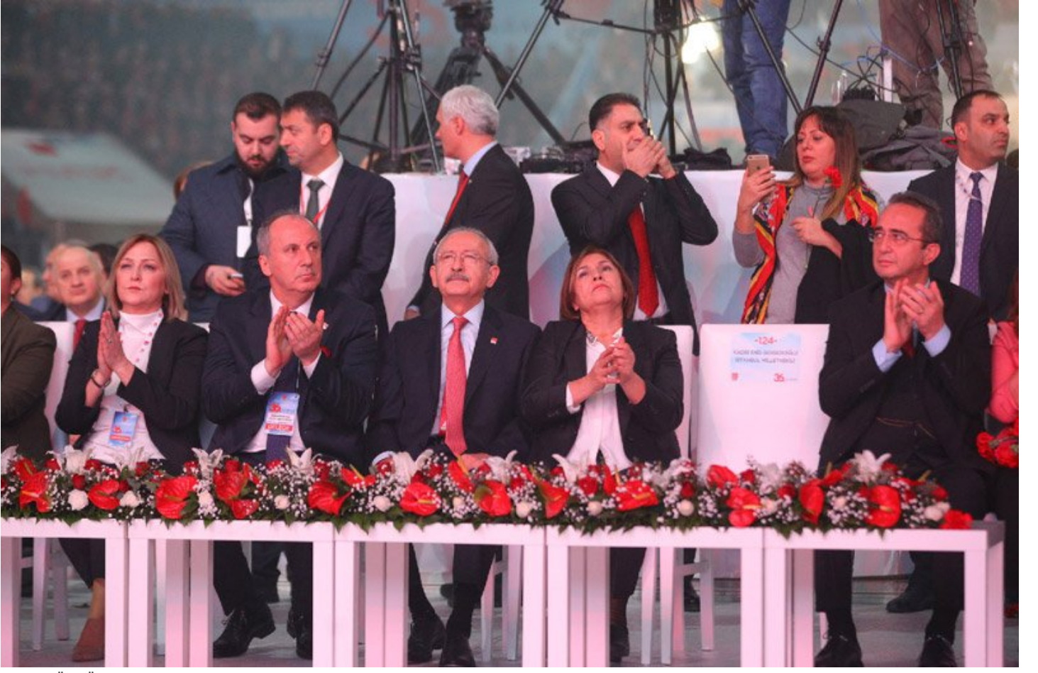
Selvi Kılıçdaroğlu ile Bülent Tezcan'ın arasındaki koltuk, tutuklu milletvekili Enis Berberoğlu'na ayrıldı.

11:50 CHP lideri Kemal Kılıçdaroğlu salona girdi. Kılıçdaroğlu eşi Selvi Kılıçdaroğlu ile birlikte partilileri selamladı. Kemal Kılıçdaroğlu, adalet yürüyüşünün slogan şarkısıyla salona girdi. Eşiyle birlikte salonu selamlayan Kılıçdaroğlu, CHP'lilere kırmızı karanfil attı.