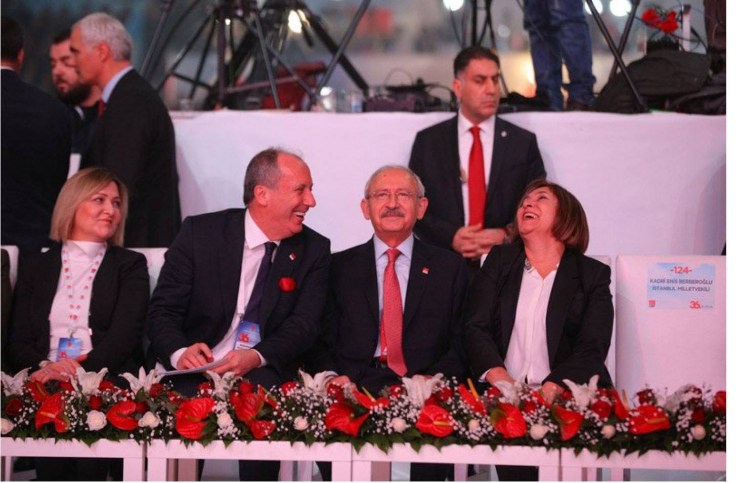
Kılıçdaroğlu ve İnce çiftinin samimi sohbetleri dikkatlerden kaçmadı.

dönemde “Osmanlı'nın meşrutiyet döneminde bile olmayan” tek adam rejimini oturtma hevesinde olan iktidara yüklenen Büyükerşen, “Aziz Atatürk 'ün dediği gibi ‘cumhuriyeti kuran Türkiye halkına, Türk milleti denir’. Ve işte bizler o milletiz. Yoksa bazılarının tanımlamaya çalıştığı gibi milletimizi cemaat, ümmet, tarikat ve etnik kökenler gibi sıfatlarla sınıflandırmaya kalkmak, gerçekte millet bütünlüğünü bozan ve devleti çöküşe götürececek olan bir bölücülüktür” dedi.