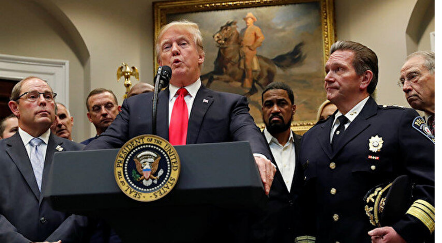
ABD Başkanı Donald Trump

Haber Merkezi • 15 Kasım 2018, 20:06 • Son Güncelleme: 15 Kasım 2018, 21:28 • Diğer