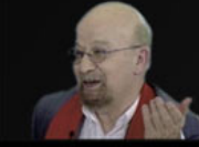
YALÇIN KÜÇÜK'ÜN KİTABINDAN NOTLAR

...in kağına olmaması gerektiğini yapıyorum. Bundan başlayarak ilerlemeye devam etmek istiyorum. Wefat, Tevbe, Ülke ve Gündem, bir kağına olmaması parçalan oluyorlar. Gündem de rayına oturacaktır; kimseyle konuşmam olmamasına ineriyorum. Yalnız bunlar değil, "Çerçev" de başarı olmak durumundadır. Demokratın yeme dışı olarak huzurlu da başarılı olmak zorundadır. Hepinize yer var. Hepsini geniş anlamda "Benim" sayılmaları; aramızdaki tartışmadan beni dışı tutmamak ve beni de ötekili yapmam gerektiğini düşünüyorum. Hepinize yer var ve beğenisi, kendisi ve yeni ekibimize yarınları marifetleriyle