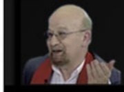
YALÇIN KÜÇÜK'ÜN KİTABINDAN NOTLAR

Apo'nun yaşamına suikastlar düzenlendiğini biliyorum. Beni yolcu ederken kamptan fazla ayrılmamasını rica ettim.