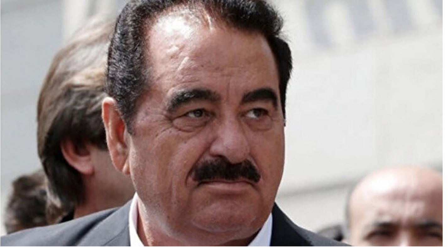
Sanatçı İbrahim Tatlıses.