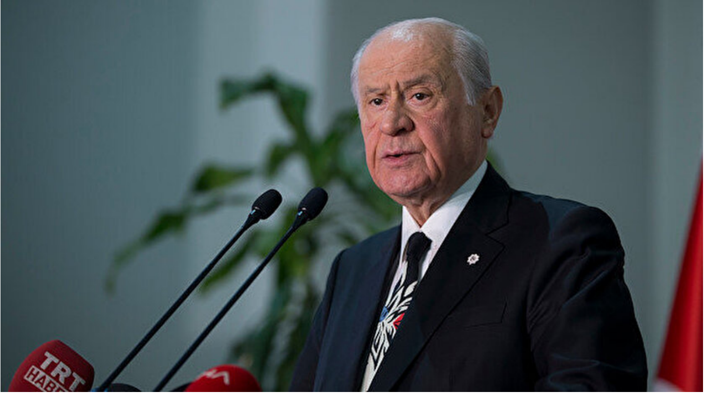
MHP Lideri Devlet Bahçeli.