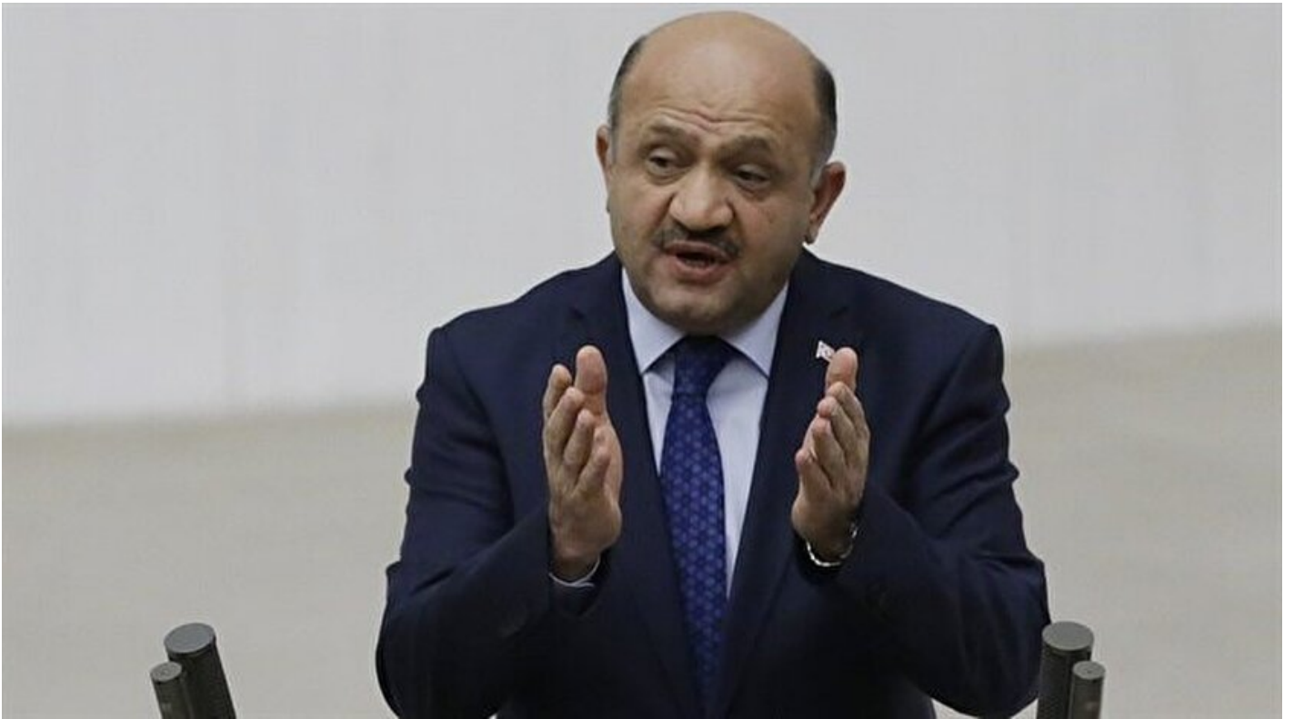
Başbakan Yardımcısı Fikri Işık