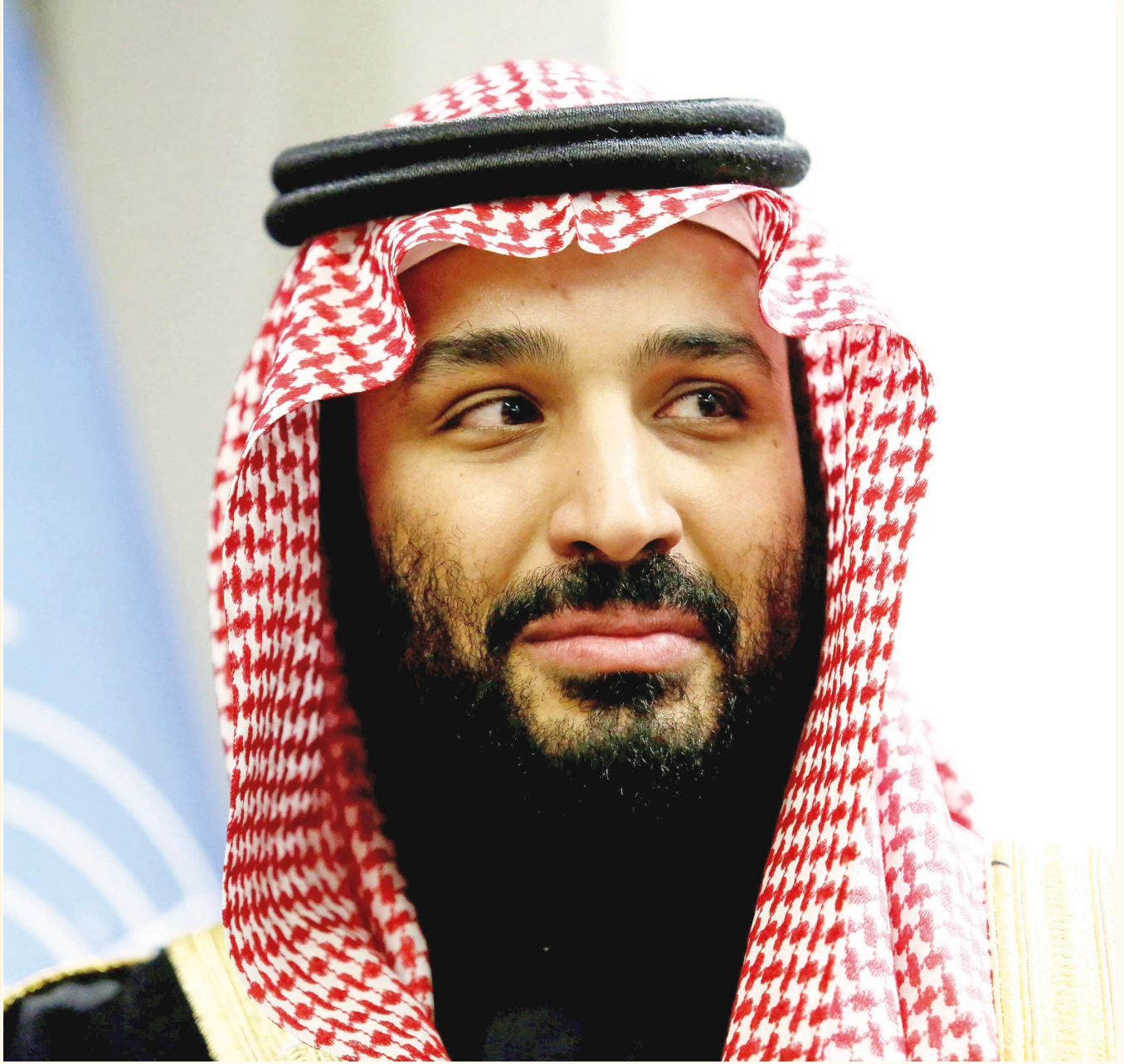
Suud Veliht Prensi Selman

Dabi ve Riyad ın FKK ile temasının hiç olmadiğı kadar ogalığını gosteriyor.