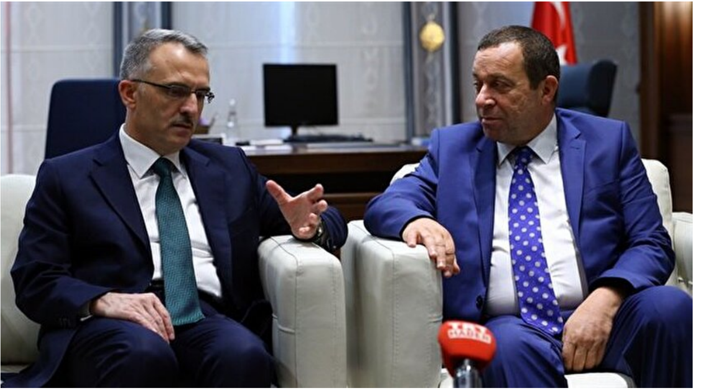
Maliye Bakanı Naci Ağbal ile KKTC Maliye Bakanı Serdar Denktaş.