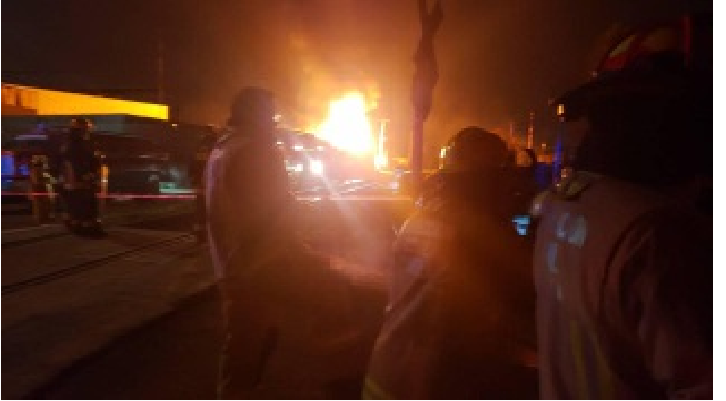
Dolmabahçe Sarayı'nda yangın!