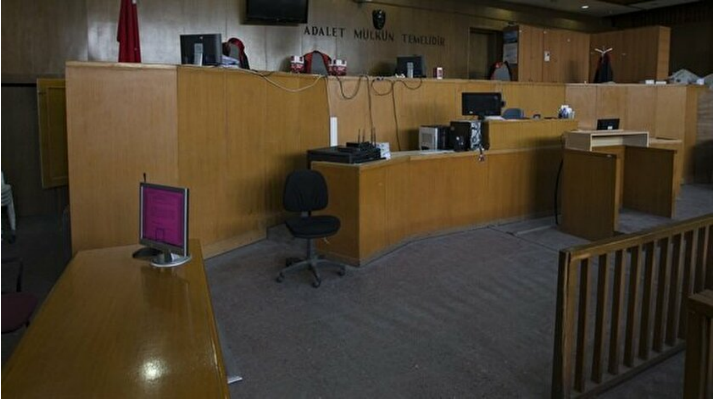
Mahkeme salonu - Arşiv

Haber Merkezi · 27 Mart 2018, 17:17 · Son Güncelleme: 27 Mart 2018, 17:22 · AA