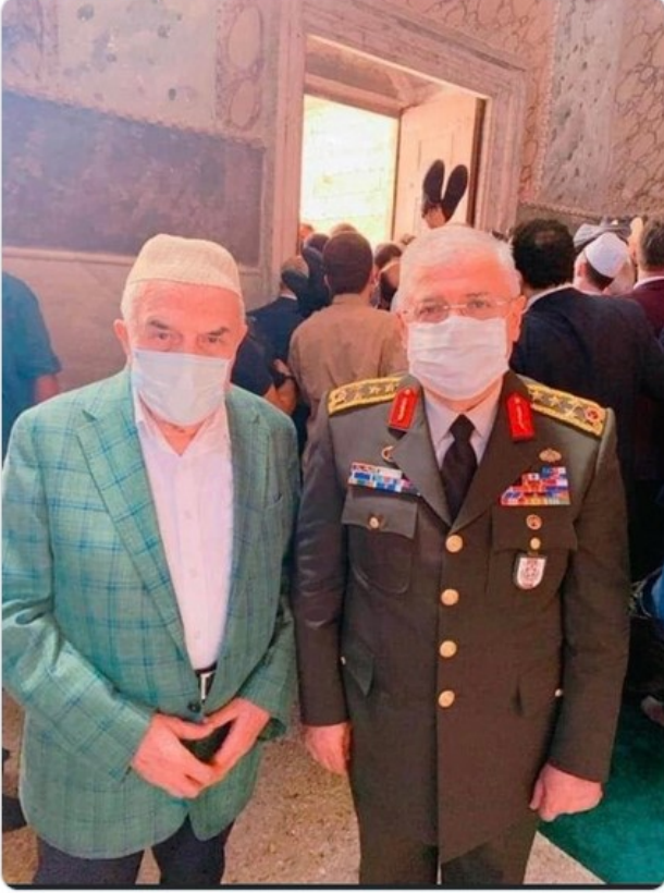
ÖS 4:11 · 26 Tem 2020 · Twitter for iPhone