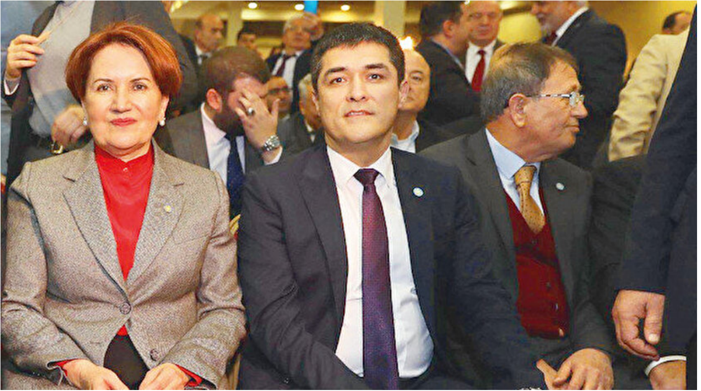
Meral Akşener ve Buğra Kavuncu