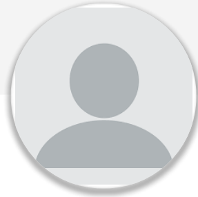
Salih Seçkin Sevinç