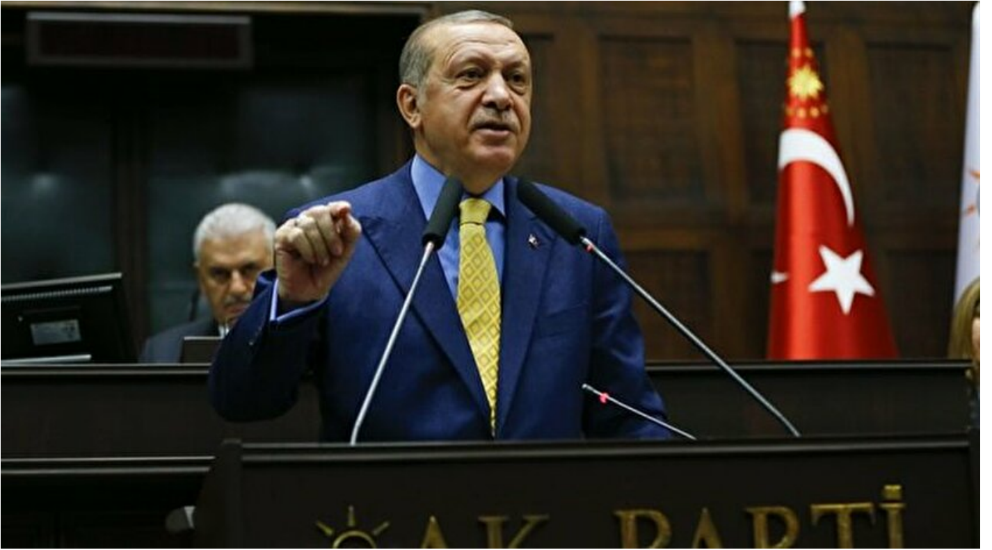
Cumhurbaşkanı ve AK Parti Genel Başkanı Erdoğan