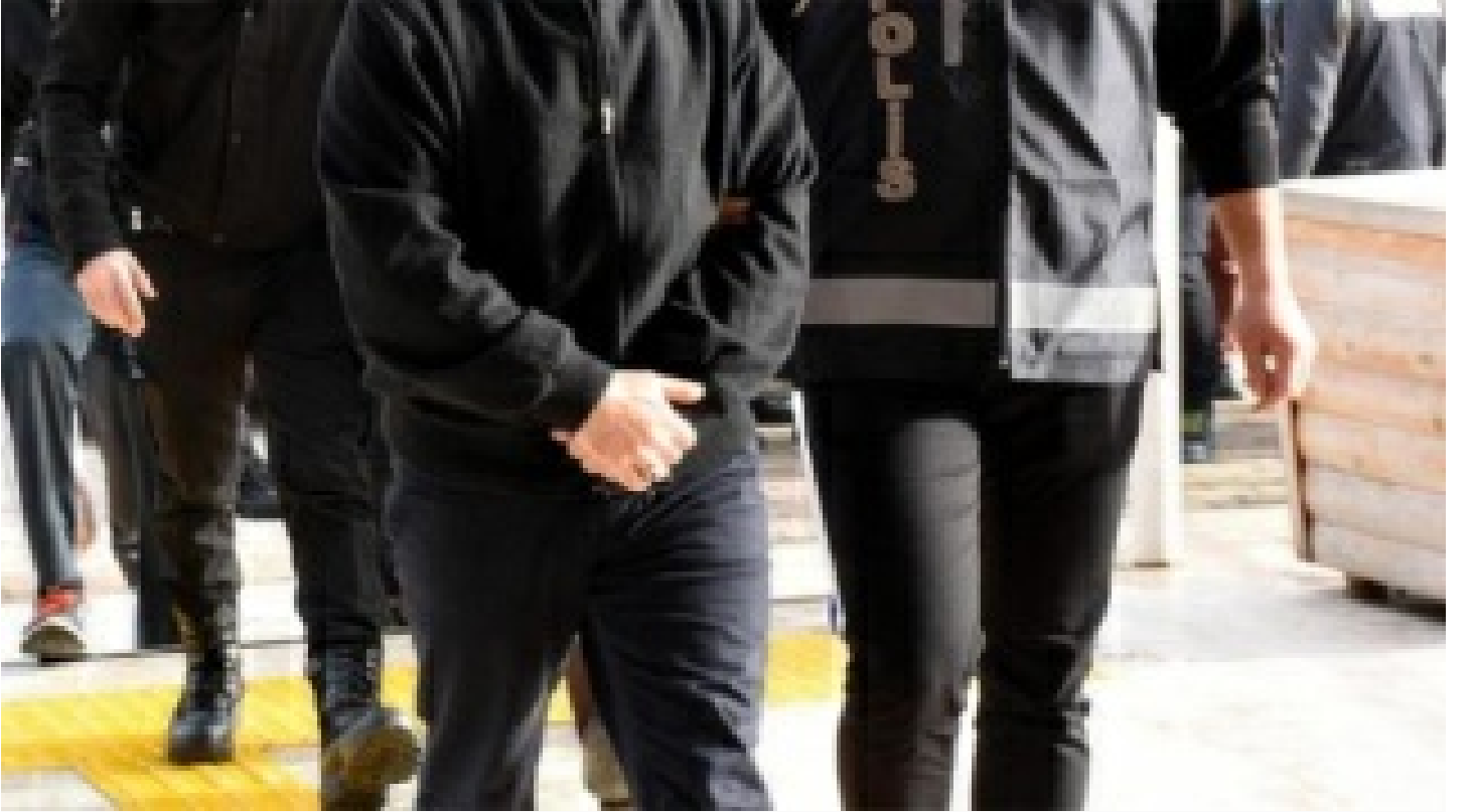
Balıkesir merkezli 4 ilde FETÖ operasyonu: 26 gözaltı