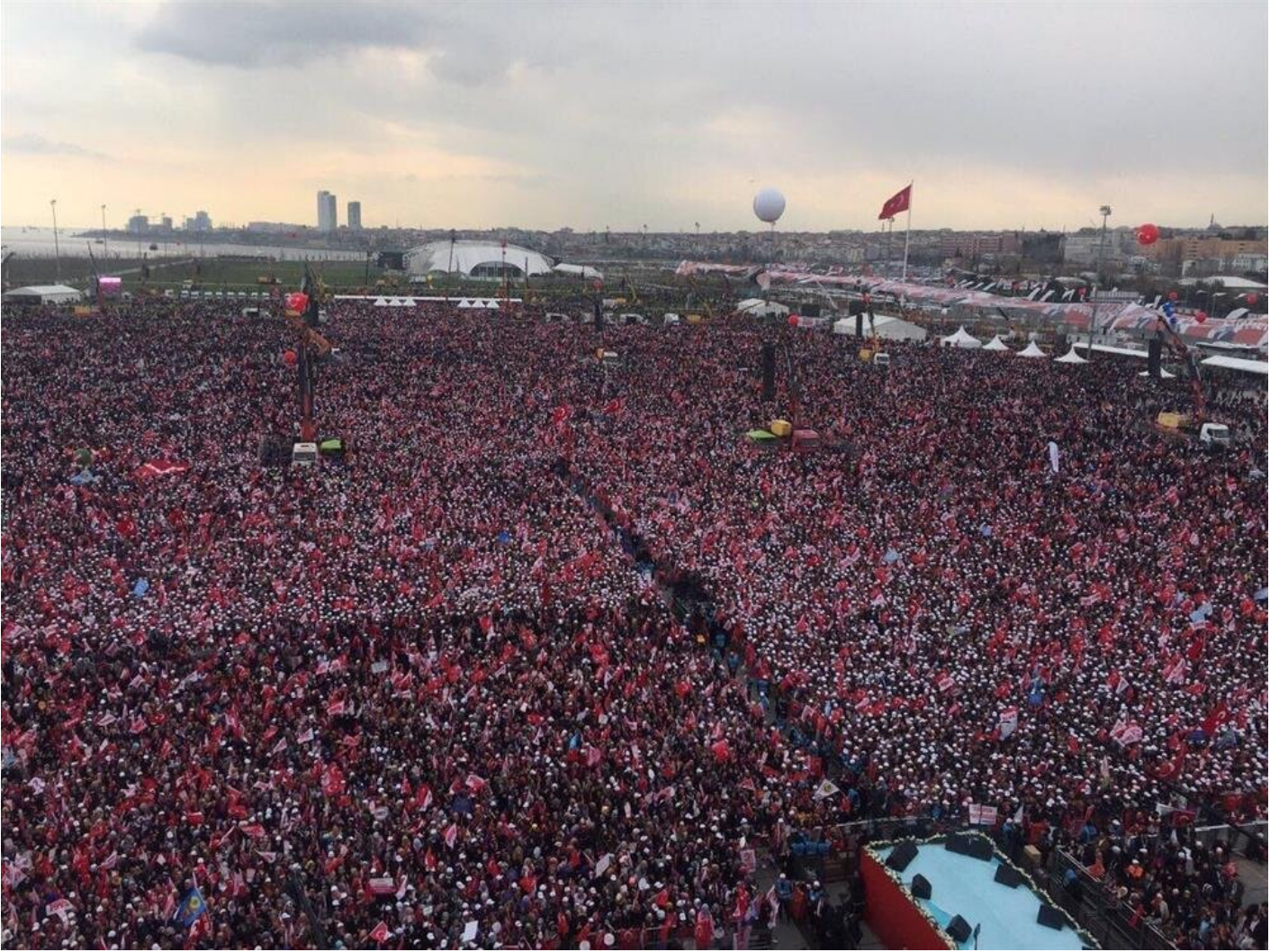
Yenikapı mitinginin havadan çekilmiş fotoğrafı.

Vatandaşların eşlik ettiği Erdoğan konuşmasını, "Yenikapı ruhu işte bu. Yenikapı ruhu asla ölmedi, ölmeyecek. Sadece bu ruha layık olmayanlar gidip kendilerine yakışan safa geçtiler o kadar. Rabbim sizden razı olsun. Hepinize sevgiler saygılar sunuyorum. Kalın sağlıklı. İnşallah 16 Nisan, yeni bir milat olacak. Allah'a emanet olun." diyerek tamamladı.