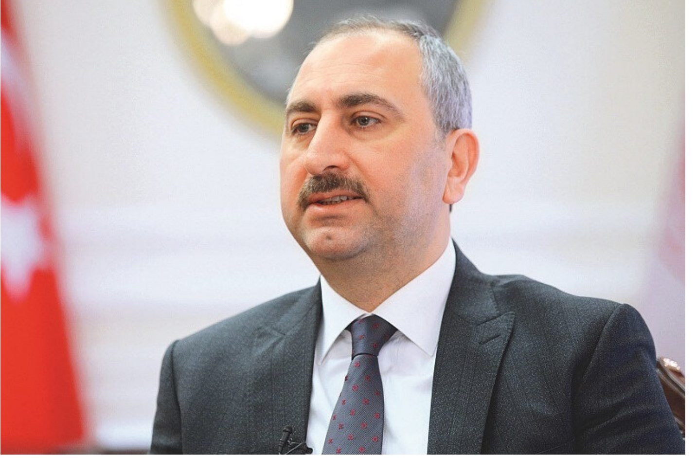
Adalet Bakanı Gül,