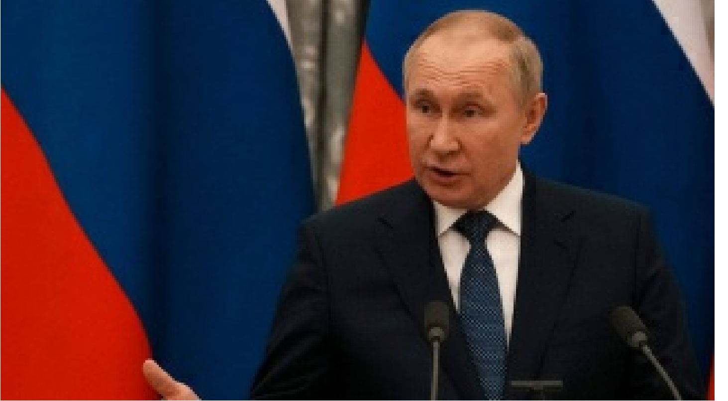
Putin'den ülkelere ilişkileri normalleştirme çağrısı