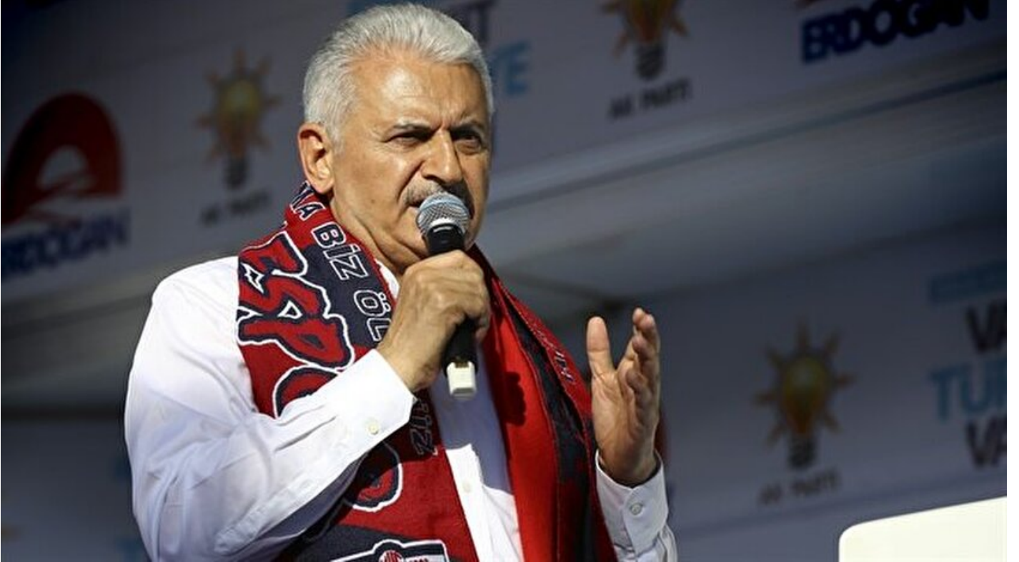
AK Parti Genel Başkanvekili ve Başbakan Binali Yıldırım

Haber Merkezi · 12 Haziran 2018, 18:55 · Son Güncelleme: 12 Haziran 2018, 19:03 · AA