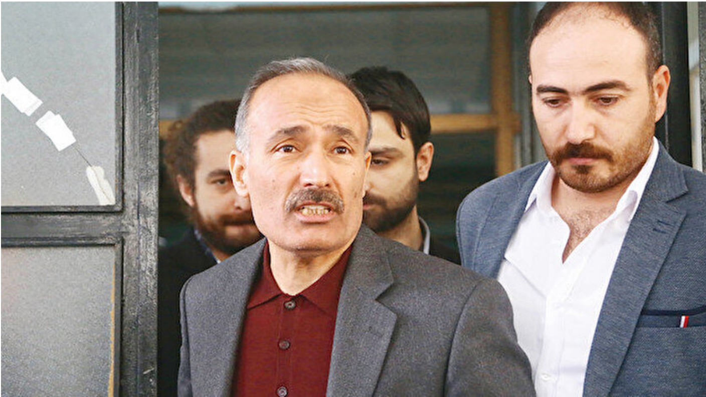
Emniyet İstihbarat Daire Başkanı Ramazan Akyürek