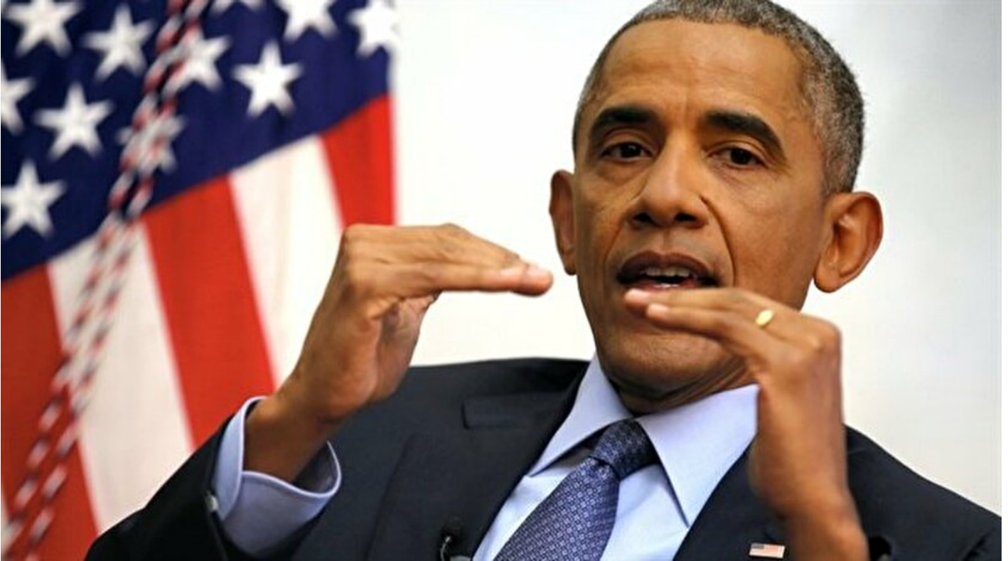
ABD Başkanı Barack Obama

Haber Merkezi · 07 Ocak 2017, 12:45 · Son Güncelleme: 07 Ocak 2017, 12:54 · AA