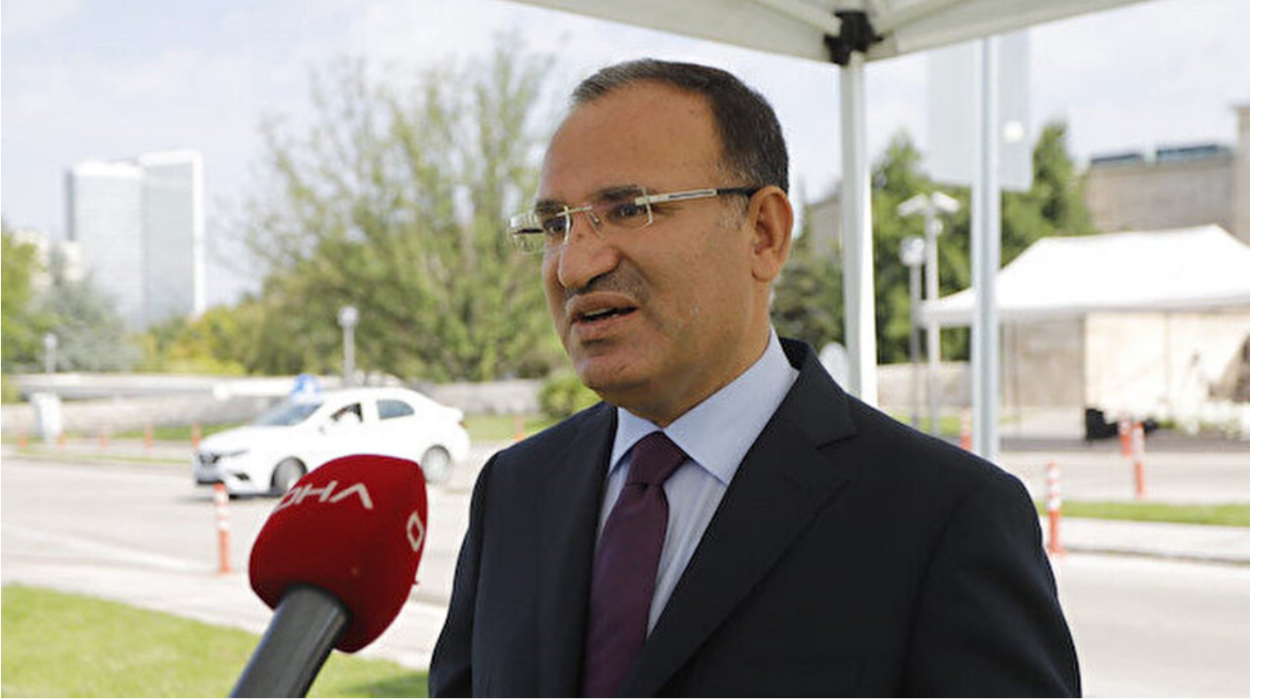
TBMM Anayasa Komisyonu Başkanı Bekir Bozdağ