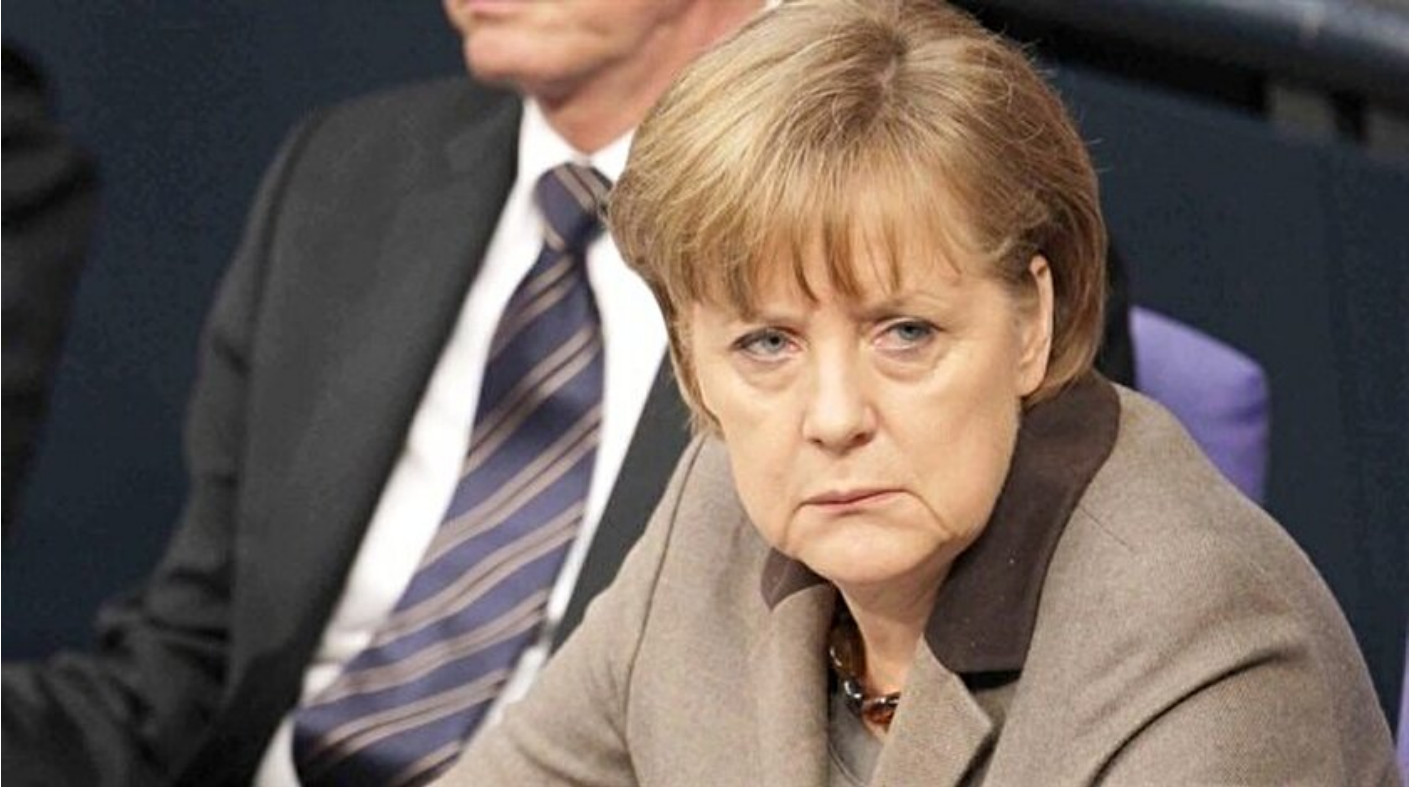
Almanya Başbakanı Angela Merkel

Haber Merkezi · 23 Eylül 2017, 04:00 · Son Güncelleme: 23 Eylül 2017, 04:30 · Yeni Şafak