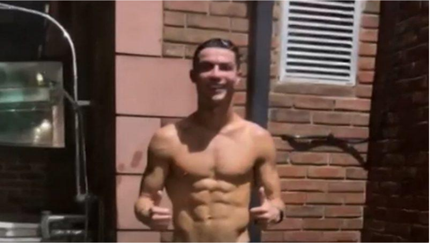
Ronaldo canlı yayında duş aldı, 1 milyon kişi izledi Sosyal Medya