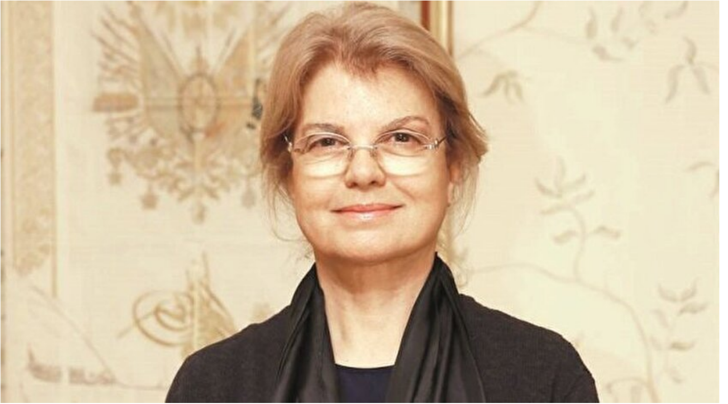
Eski Başbakan Tansu Çiller