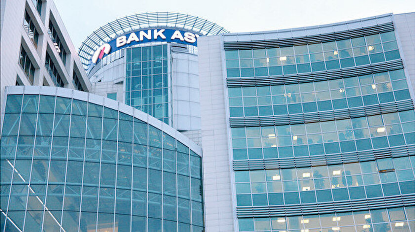
Bank Asya (Arşiv)

Osman Özgan · 18 Şubat 2019, 04:00 · Son Güncelleme: 18 Şubat 2019, 10:35 · Yeni Şafak