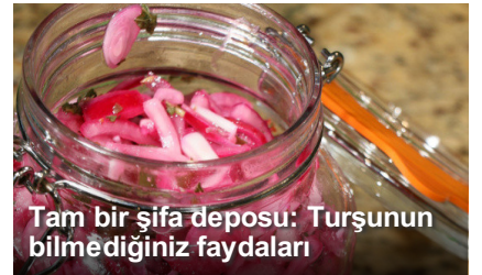
Tam bir şifa deposu: Turşunun bilmediğiniz faydaları