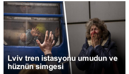
Lviv tren istasyonu umudun ve hüznün simgesi