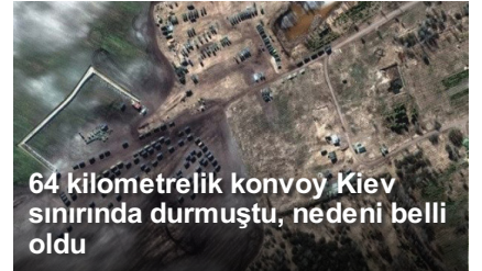
64 kilometrelik konvoy Kiev sınırında durmuştu, nedeni belli oldu