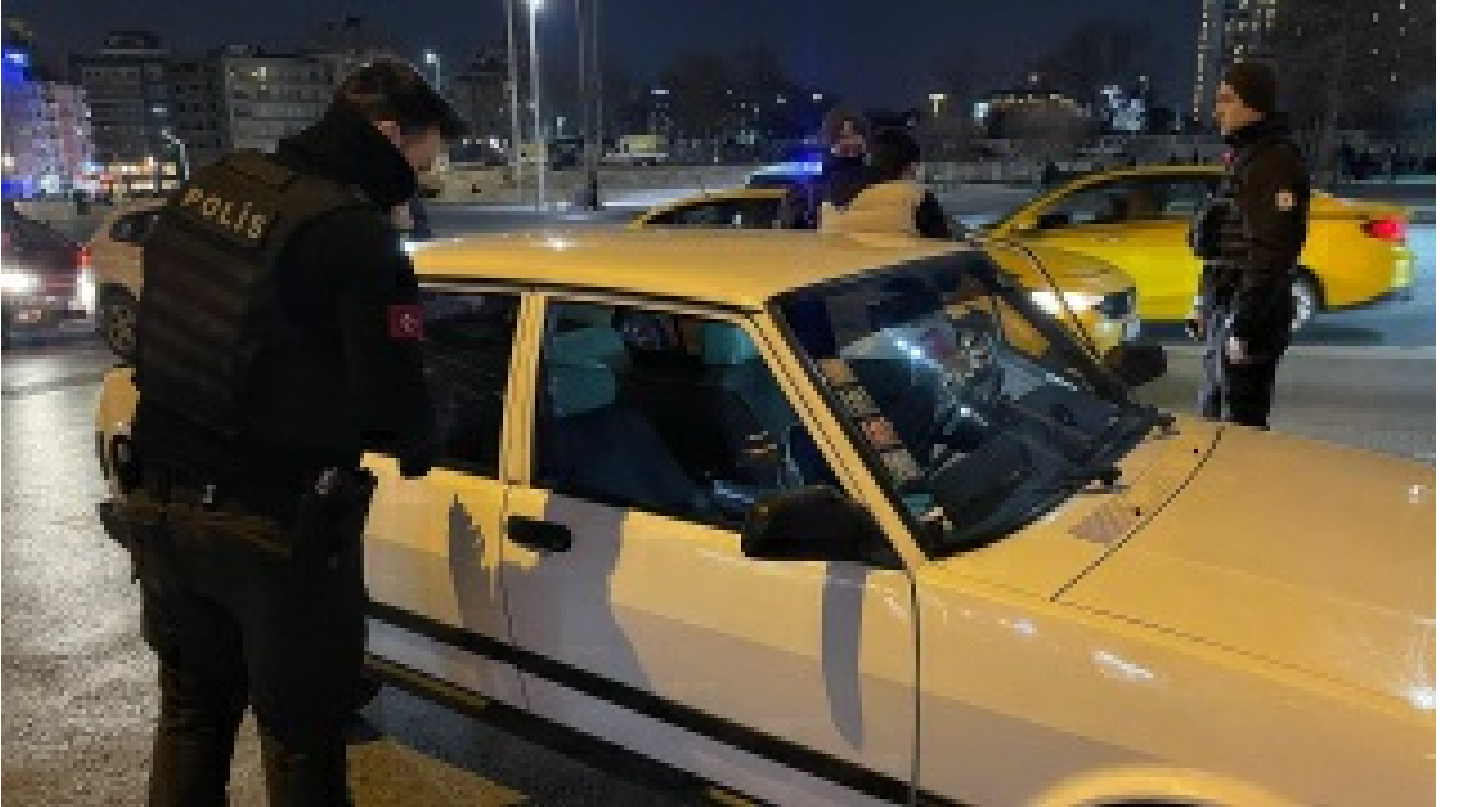
İstanbul'da "Yeditepe Huzur" asayiş uygulaması