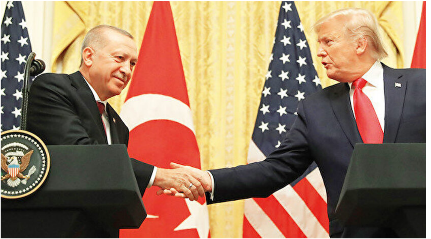
Cumhurbaşkanı Erdoğan ve Donald Trump