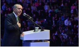
Cumhurbaşkanı Erdoğan'dan flaş Suriye açıklaması

Çavuşoğlu, geçtiğimiz gün FETÖ elebaşı Fetullah Gülen dahil Fetullahçı Terör Örgütü'ne üye 84 kişinin Türkiye'ye iadesine yönelik listeyi ABD'ye sunduklarını açıklamıştı. Bu konuda Erdoğan ile Trump'ın görüşme yaptığını da belirten Çavuşoğlu, "En son Buenos Aires'te bir araya geldiğimizde ABD Başkanı Donald Trump, Cumhurbaşkanı Recep Tayyip Erdoğan'a bu konu üzerinde çalıştıklarını söyledi ancak somut adımları görmemiz gerek." demişti.