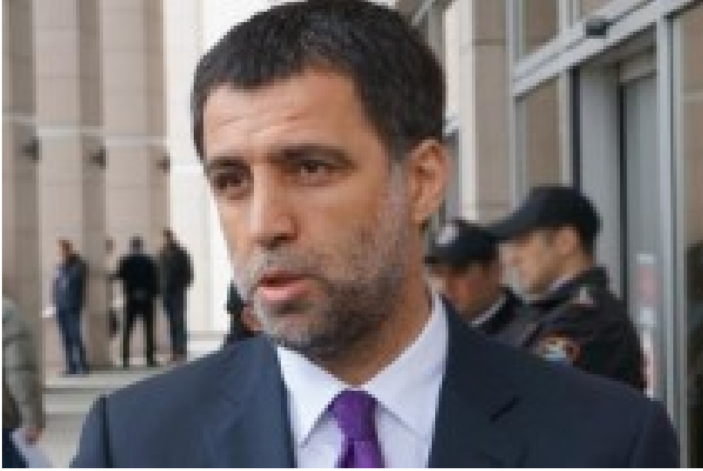
FETÖ'cü Hakan Şükür'ün Yeni Mesleği Pes Dedirtti!