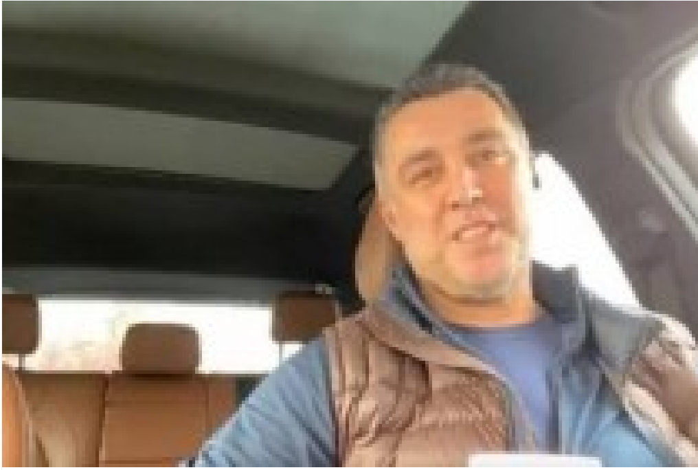
FETÖ Firarisi Hakan Şükür'ün Yeni Mesleği Şaşırttı!