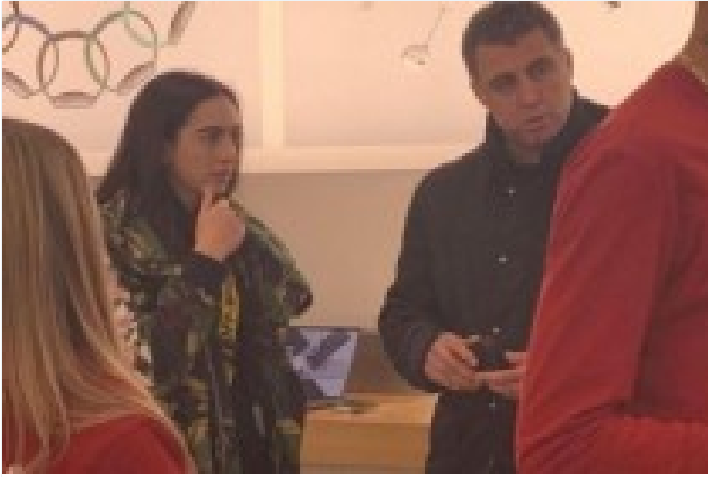
FETÖ'cü Hakan Şükür'ün Yeni Görüntüleri Ortaya Çıktı