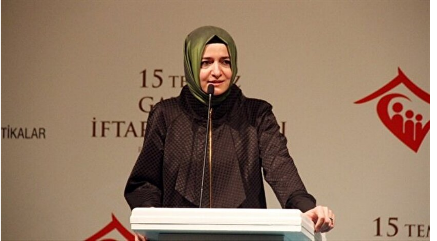
Fatma Betül Sayan Kaya