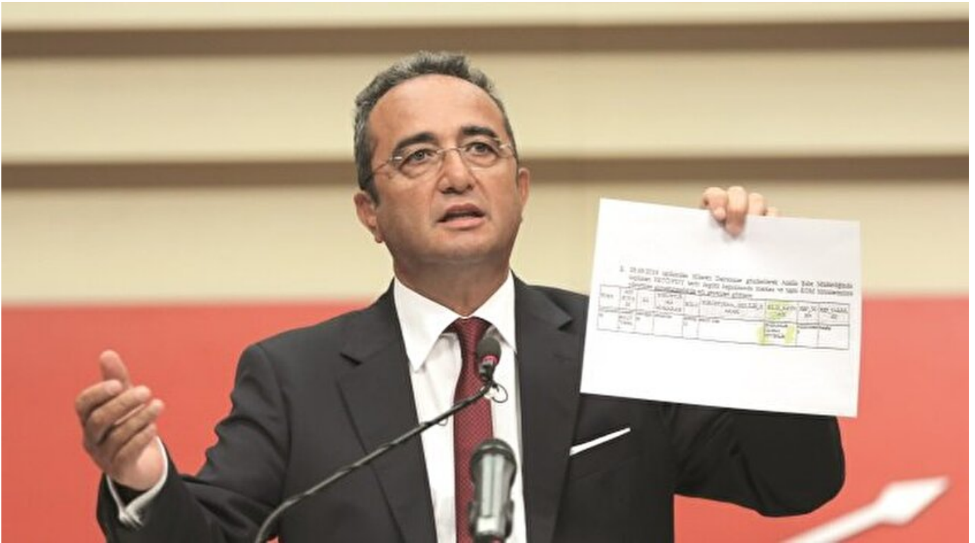
CHP Sözcüsü Bülent Tezcan