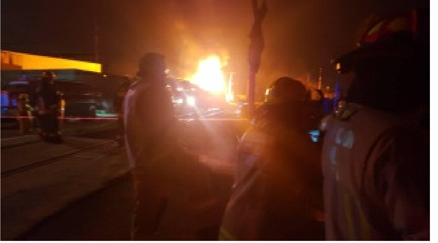
Dolmabahçe Sarayı'nda yangın!