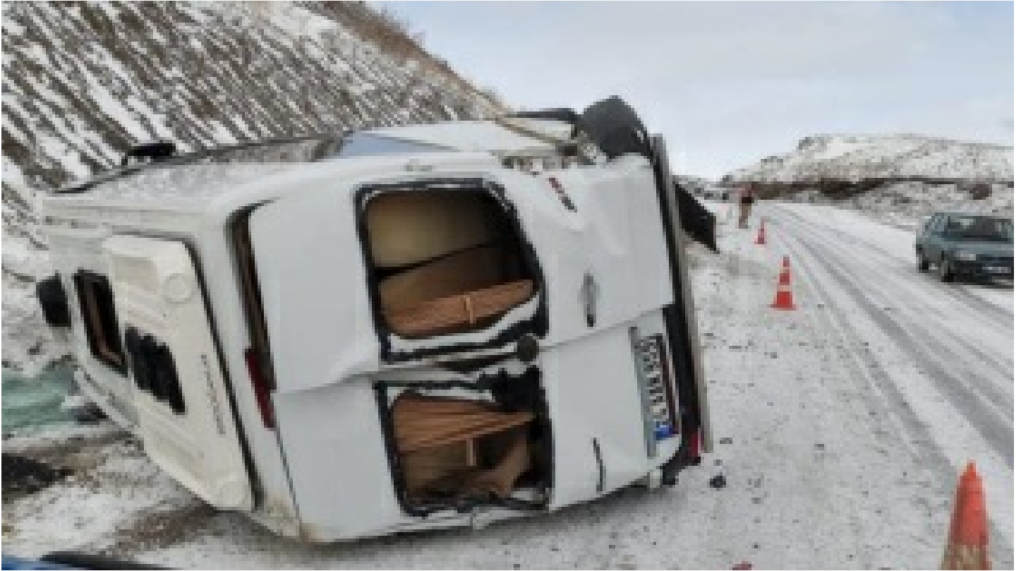
Erzincan'da devrilen minibüsteki 8 kişi yaralandı