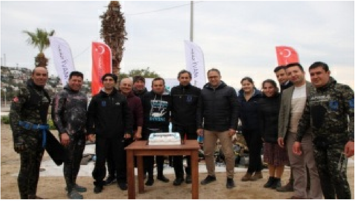
Dalgıçlar denizi, öğrenciler kıyıyı temizledi