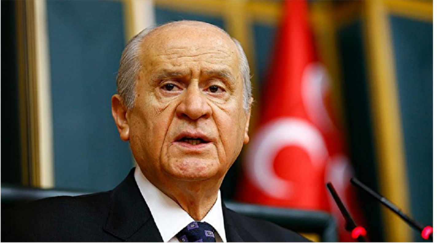
MHP Genel Başkanı Devlet Bahçeli