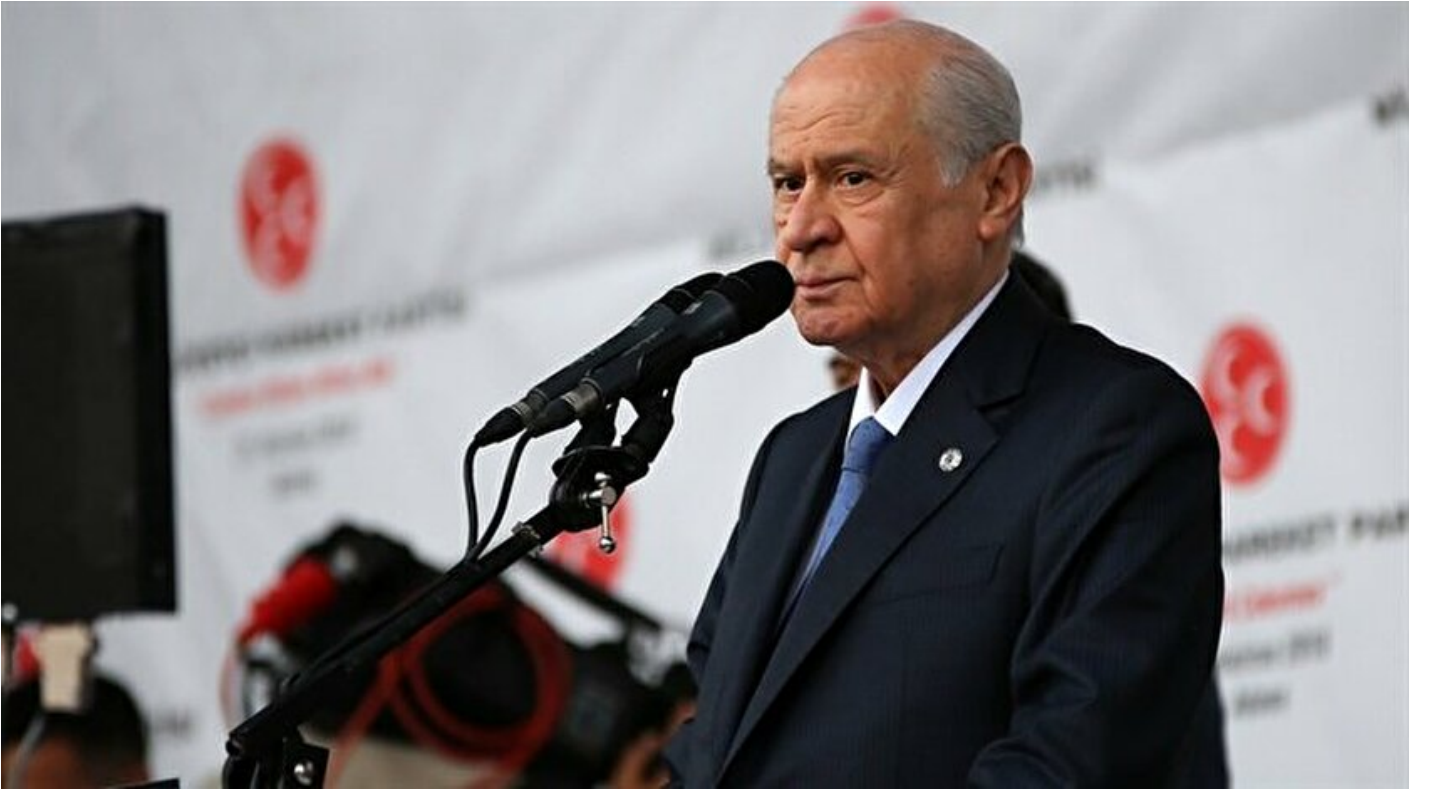
MHP Genel Başkanı Devlet Bahçeli

Haber Merkezi · 21 Haziran 2018, 19:54 · Son Güncelleme: 21 Haziran 2018, 20:22 · AA