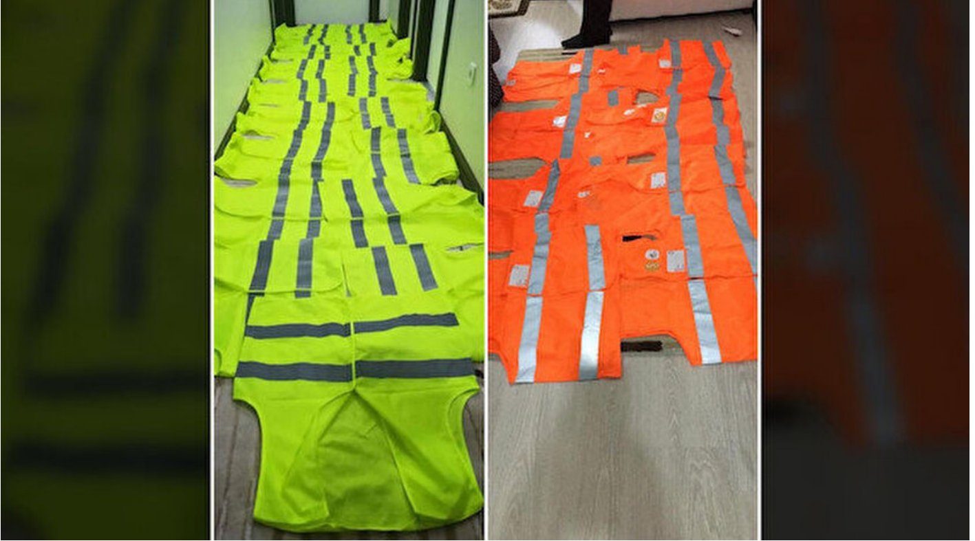
Bursa'da FETÖ'nün gaybubet evinde ele geçirilen sarı ve turuncu yelekler