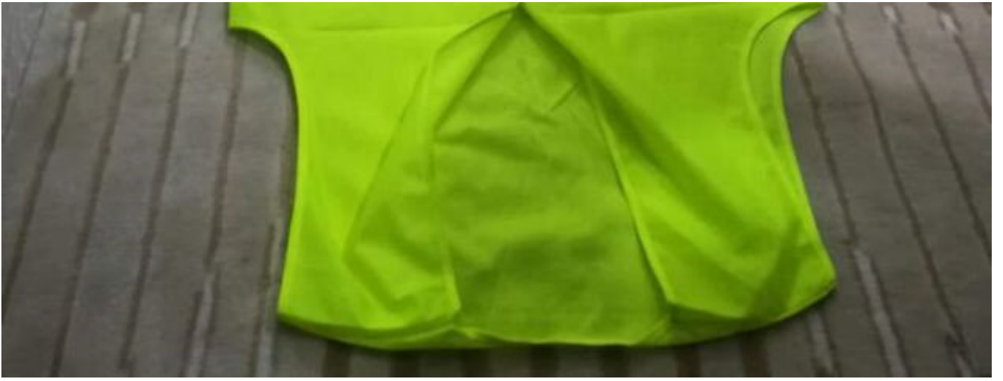
FETÖ'nün hücre evinde ele geçirilen sarı yelekler